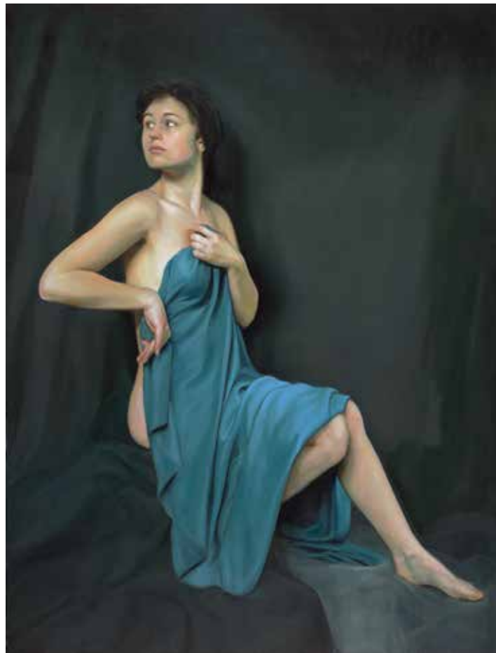
Egbert Modderman: Onschuld (2016)

Inspiratie voor deze schilderijen haalt de schilder uit zijn eigen achtergrond, de christelijke traditie. Vanuit deze traditie kent hij de verhalen waarin menselijkheid in al haar eenvoud, complexiteit en dramatiek naar voren komt.