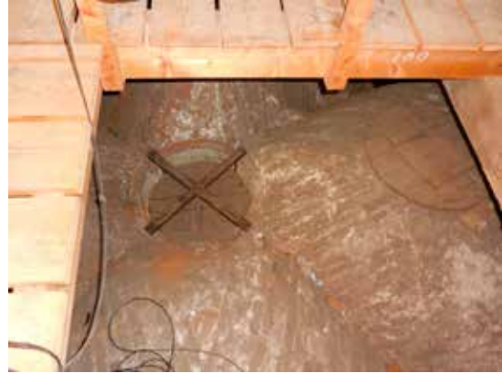
Het "Hemelgat" in de Martinikerk van bovenaf gezien

Vanaf 1468, nadat de eerste toren was ingestort, is de kerk uitgebreid met twee dwarsschepen in westelijke richting. Toen is dit hijsgat aangebracht, evenals de schilderingen op de gewelven.