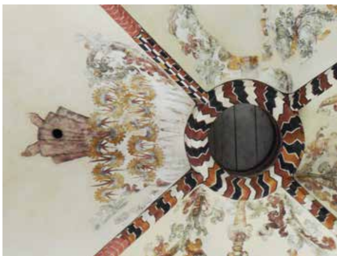
Het “Hemelgat” in de Der Aa-kerk

De kerk was Rooms Katholiek en daarin was aanschouwelijk onderwijs belangrijk, in het bijzonder over de Passiegeschiedenis, omdat in de middeleeuwen het kerkvolk grotendeels analfabeet was. Vandaar dat in allerlei schilderingen het leven van Jezus is weergegeven, zoals in de secco’s in het koor van de Martinikerk. Schilderingen zijn echter statisch, maar juist bij de herdenking van de hemelvaart van Jezus kon een stukje realiteit worden getoond, naar aanleiding van Handelingen 1: 9 “en Hij werd opgenomen terwijl zij het zagen, en een wolk ontrok Hem aan hun ogen”.