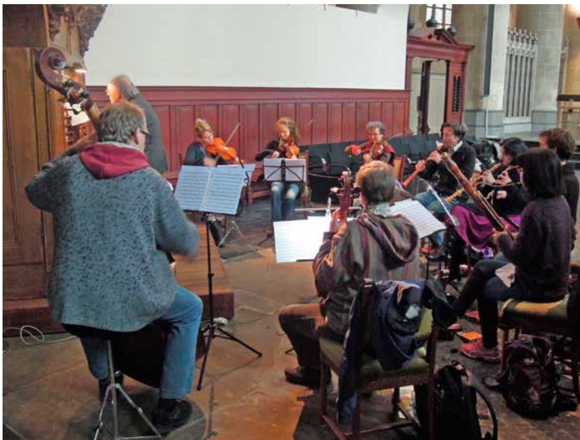
Repetitie voor de opname van de cd

De ruimte in het koor voor dit concert is beperkt. Wees dus snel met reserveren op www.klassiekemuziek.nl !