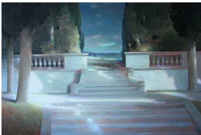
Edwin Aafjes: Paterno

De Klassieke Academie voor beeldende kunst in Groningen bestaat 10 jaar. Vanaf 2005 bleek de academie in een grote behoefte te voorzien van mensen die klassiek vakonderwijs wilden volgen en daarvoor op de reguliere academies niet terecht kunnen. In 2010 werd de schilderopleiding uitgebreid met een dependance beeldhouwen waardoor ons land sinds lange tijd weer een echte beeldhouwopleiding rijk is. Op gezette tijden voorziet de Klassieke Academie in publiciteit in de vorm van manifestaties zoals het geven van demonstraties schilderen en beeldhouwen, workshops, masterclasses en exposities met werk van alumni en docenten of, zoals dit jaar, een grote expositiemaniestatie onder de titel De Klassieke Salon . Op 19 locaties in het Noorden exposeren 130 schilders en beeldhouwers. Eén van de locaties is de Martinikerk in Groningen. Daar presenteert een groot aantal kunstenaars zowel figuratieve als abstracte kunst en alles daartussen.