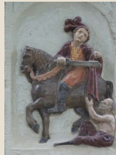
Hoorn

In Hoorn is een gevelsteen te zien met een heel andere voorstelling. Op bijna sobere wijze is het verhaal samengevat: Sint Maarten, met een enigszins jong uiterlijk, die met een behoorlijk groot