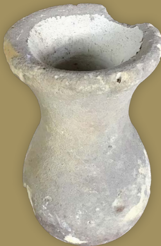
▲ Klankpot aanwezig in Martinikerk

Er zijn naar schatting zo'n 200 middeleeuwse kerken in heel Europa geweest waarin klankpotten zijn aangetroffen, waarvan ongeveer twintig in Nederland. Er waren vast veel meer klankpotten, maar door restauraties zijn veel van die klankversterkers verwijderd of dichtgesmeerd bij het aanbrengen van een nieuwe pleisterlaag.