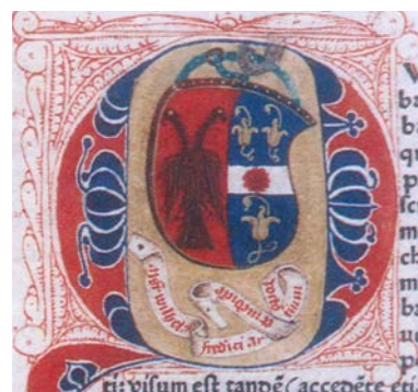
◀ Wapen van Wilhelmus Frederici

Hoewel Frederici zowel nationaal als internationaal contact had met de grote geesten van zijn tijd, is er in de uitgebreide correspondentie van Erasmus slechts één brief te vinden die hij aan hem heeft geschreven.