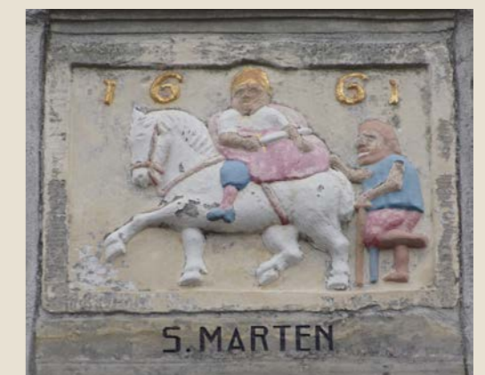
Makkum

Nog een andere steen is te zien in Makkum. Die steen is gedateerd 1661. Maar de verhoudingen zijn bijna figuratief te noemen. Nu werkt een steenhouwer ook anders dan een schilder of een pottenbakker. De beheersing van een verfijnde beeldhouwtechniek is niet bij voorbaat aanwezig, zeker niet bij deze voorstelling. Vooral de bedelaar moet het behoorlijk ontgelden. Maar let op: hier heeft hij nog wel zijn linkerbeen. Bij de andere twee voorstellingen was dat geamputeerd. Het onderbeen steunt echter wel op een prothese, of een houten been. Sint Maarten snijdt weliswaar zijn mantel in tweeën maar kijkt in een heel andere richting dan naar zijn begunstigde. Bij de andere twee gevelstenen (Grootebroek en Hoorn) zou je nog een blik van mededogen of bewogenheid kunnen ontdekken.