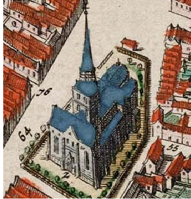
▲ Westbouw van de der Aa-kerk zoals afgebeeld op een kaart van Joan Blaeu uit 1649.

De kroniek van Sicke Benninge, die vrij nauwgezet de bouwgeschiedenis van de kerk tussen 1452 en 1469 weergeeft, verhaalt niet van een instorting in 1408, noch van een tweede toren van 45 meter hoog; wel van een westelijke aanbouw – 'nie muerwarck mijtten toernen ant westen van Sancte Mertens toerne' – gerealiseerd na de uitbreiding tot hallenkerk (zoiets als de aanbouw van de Aa-kerk op een oude stadskaart?) Volgens Benninge werd het 'nie muerwarck ...'- tussen 1452 en 1464 gerealiseerd rond de 'olden toern'. Zou hij onderscheid gemaakt hebben tussen nieuw ('nie muerwarck') en oud ('olden toern') bij vrijwel tezelfdertijd opgerichte bouwwerken?