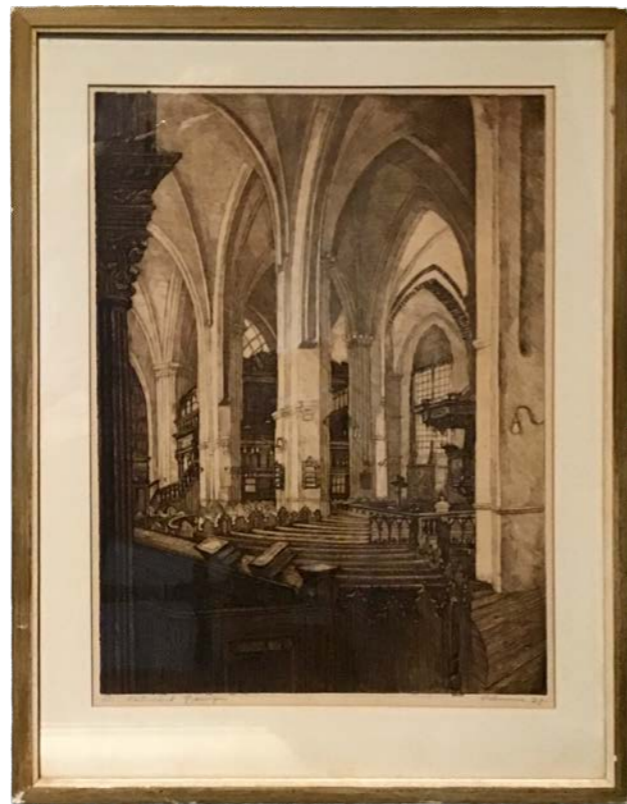
▲ Aquarel uit 1929