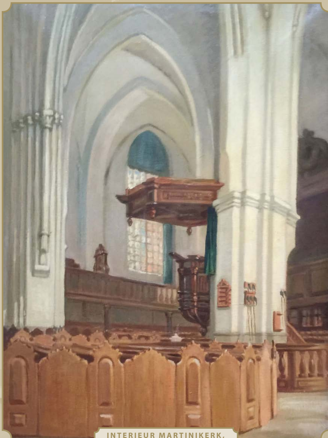
INTERIEUR MARTINIKERK, PIETER SENNEMA, 1935