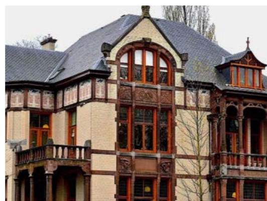
Huize Tavenier

de natuur, organische vormen, golvende lijnen, gracieus gestileerd, decoratief. Het is sierlijke kunst als reactie op massaproductie. Een bekend voorbeeld zijn de affiches die rond 1900 zijn gemaakt door Jan Toorop voor tentoonstellingen en producten (zie maisonartnouveau.nl ). Prachtige voorbeelden van Jugendstil-architectuur in Groningen zijn te zien aan de Ubbo Emmiussingel 110 (Huize Tavenier), het voormalige gebouw van het Nieuwsblad van het Noorden aan het Zuiderdiep en in de hal van het Hoofdstation. Arno Weltens en Stefan Rutten hebben hier onlangs een artikel over geschreven in Stad & Lande.