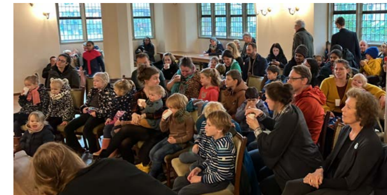
▲ Prijsuitreiking in de Kapel

Op zaterdagmiddag 11 november werden in het koor en in de kapel de lampions beoordeeld en de prijzen uitgereikt.