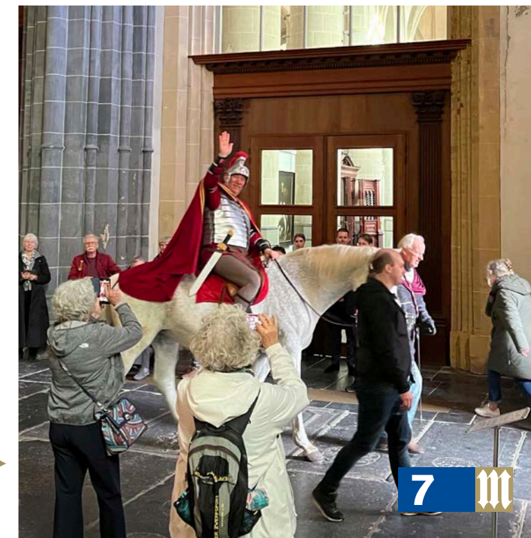
Een paard in de Martinikerk, foto: Jan Haak ►

Nieuw in 2023 was de ontvangst in de Martinikerk op 11 november van de lopers van de Gulden Martinusweg die op 1 november aan hun tocht vanuit Utrecht waren begonnen. Samen met de lopers van het Pronkjewailpad en de kinderen met hun lampions, begeleid door Sint Martinus te paard, bood deze optocht echt een fantastische aanblik.