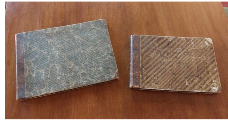
▲ De twee muziekboeken van Hauff, nu in de archiefkast van de Martinikerk

Dit zou de heer Hauff graag hebben gehoord, zoals blijkt uit de introducties in twee muziekboeken die hij schreef. Exemplaren van deze boeken, in contemporaine 19e eeuwse boekbanden, bevinden zich in de archiefkast in de Martinikerk. Hauff benadrukt hoe belangrijk het is dat zijn muziek ten dienste van zijn en andere gemeentes staat. In het 'Voorberigt' van beide boeken zegt hij dat hij gevraagd is het werk te vervaardigen. In 'De 150 Psalmen benevens de Gebeden, Lof- en Bedezangen' zegt hij daarna bijvoorbeeld: