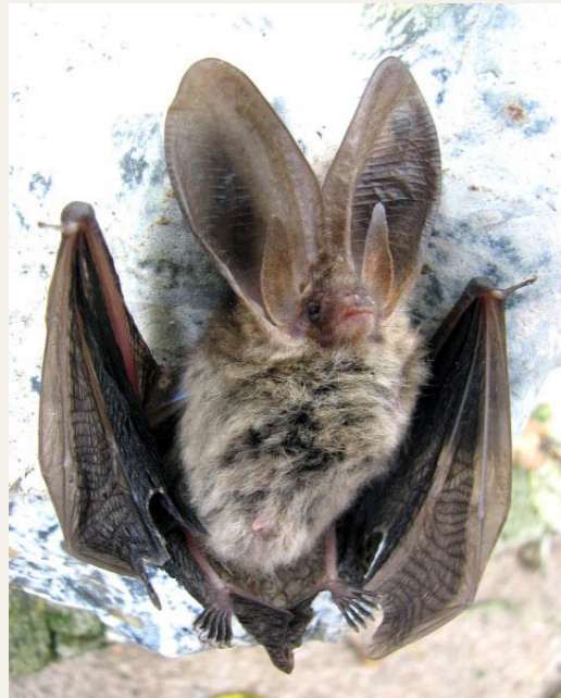
▲ Afbeelding 2: Een grootvleermuis.

Johann Christoph Wickenhagen (1774-1827) werd geboren als zoon van een 'zeemtouwer' (bereider van zeemleer) in het plaatsje Greußen, dat onderdeel was van het kleine vorstendom Schwarzburg-Sondershausen in de huidige Duitse deelstaat Thüringen. Het is onduidelijk wanneer of waarom Wickenhagen precies is geëmigreerd, maar in 1798 was hij in ieder geval al woonachtig in Delfzijl, waar zijn oudste zoon Johann Carl (1798-1829) geboren werd. In 1809 werd een volgend kind in de stad Groningen geboren en vanaf de jaren 1810 stond Johann Christoph Wickenhagen daar te boek als 'musikant', 'stadsmusikant' of 'stadstrompetter'. Dit beroep was niet ver verwijderd van dat van de torenwachter en heeft er dikwijls synoniem voor gestaan. De stadstrompetter was tevens stadsomroeper en zowel hij als de torenwachter hadden de verantwoordelijkheid om de bevolking van belangrijke ontwikkelingen op de hoogte te