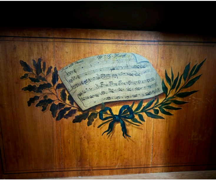
▲ Schildering boven de speeltafel van het orgel