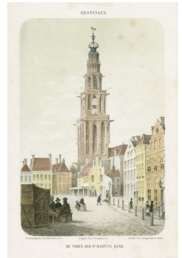
▲ De Martinitoren omstreeks 1850 vanuit het oosten gezien, met de toenmalige torenwachterswoning direct daarvoor, iets verstoep rechts achter de gecentreerde Hoofdwacht.