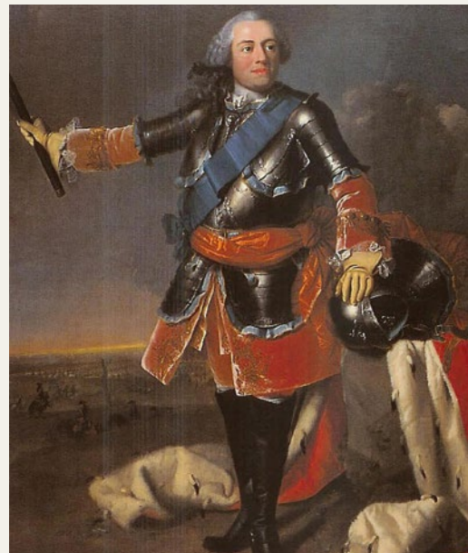
▲ Stadhouder Willem IV